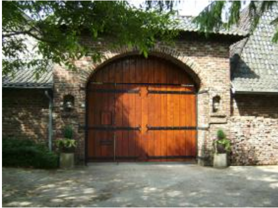
Landhaus „ Gut Bies „