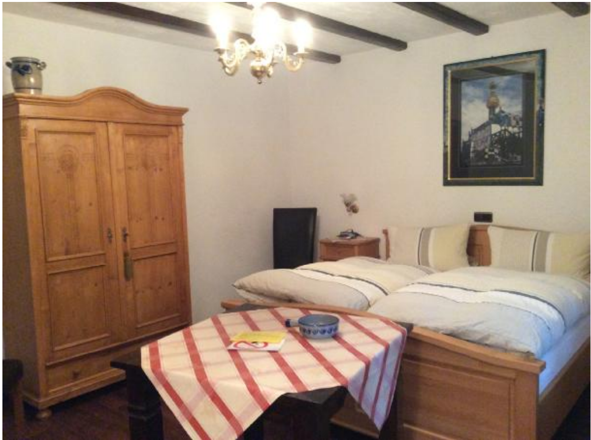
Schlafzimmer, Doppel- oder / und Einzelbett(en)

FeWo F3 ca. 73 m2, für 1 bis 3 Personen, mit Küche und Bad