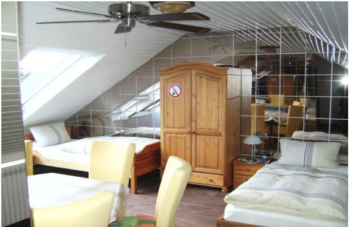
1 Doppel- 3 Einzelbetten