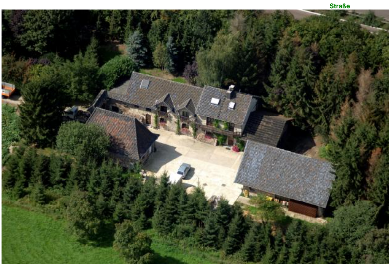
Landhaus „ Gut Bies „