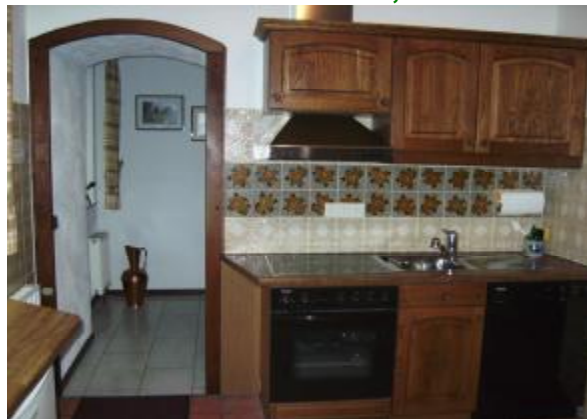
Backofen / Spülmaschine / Mikro etc.