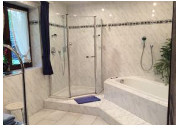
Komfort- Bad mit Wanne, DU / WC