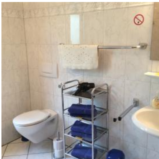
Bad / Du / WC